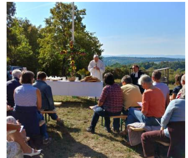
Gottesdienst am Naturfreundehaus 2018